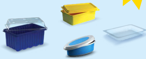
Barquettes et rapiers