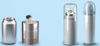
Canettes et boîtes de conserve