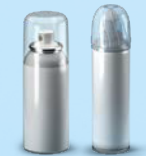
Aérosols alimentaires et cosmétiques