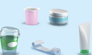
Pots et tubes